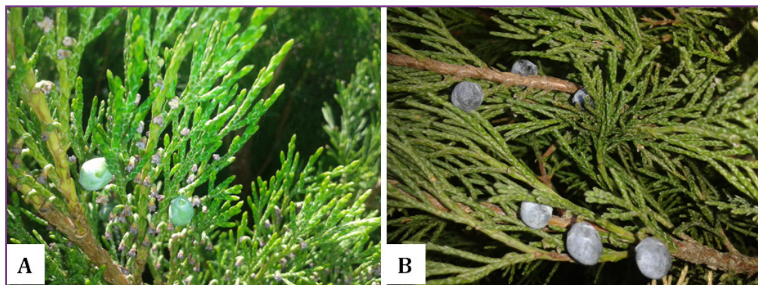
Рисунок 1 Juniperus sabina L., произрастающий в Республике Молдова (май 2017) А – цветение; В – созревание плодов

Объектами исследований служили растения вида Juniperus sabina , произрастающие в Центральной зоне Республики Молдова (рис. 1). Растения были собраны во второй декаде мая (координаты сбора 46° 57' 44.3" N 28° 53' 16.9" E) путем обрезки 30 – 50 см отросших боковых ветвей. Идентификация растения Juniperus sabina была проведена с помощью специалистов Института Ботанического сада АНМ и Института Исследований и менеджмента лесных насаждений, Кишинэу (Elisovetskaya et. al., 2014).