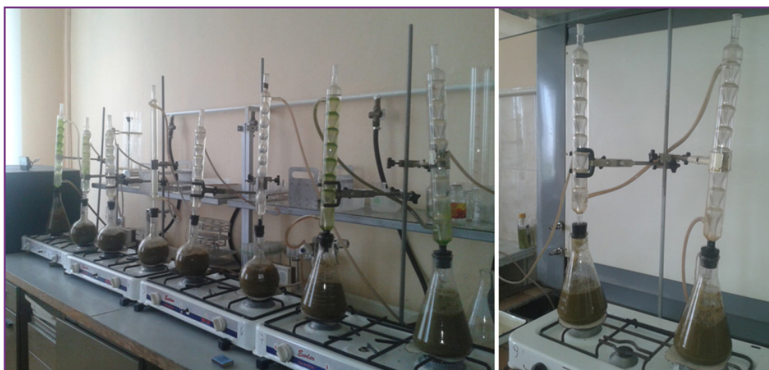
Рисунок 2 Экстракция эфирного масла из веточек и листьев Juniperus sabina L. (сухое растение) Figure 2 Extraction essential oil from twigs and leaves of Juniperus sabina L. (from dry row materials)

Извлечение эфирного масла проводили методом гидродистилляции (Hesham et.al., 2016) путем перегонки навески сырья (200 г для свежего и 100 г для сухого растения) с очищенной водой (воду добавляли в соотношении сырье : растворитель 1 : 6) в 1 – 2 литровой колбе с обратным холодильником (рис. 2). Эфирное масло собирали в подвешенный свободно в колбе приемник Гинсберга. Так как приемник не был откалиброван, его после перегонки извлекали, охлаждали на воздухе до комнатной температуры, отделяли эфирное масло с помощью микропипеток и количественно переносили его в мерные пробирки с ценой деления 0,02 мл Колбу с содержимым нагревали на газовой электроплитке или электроплитке с закрытой спиралью и регулятором мощности нагрева и кипятили в течение одного часа, двух часов, трех часов и более (до прекращения увеличения объема эфирного масла, определяемого визуально).